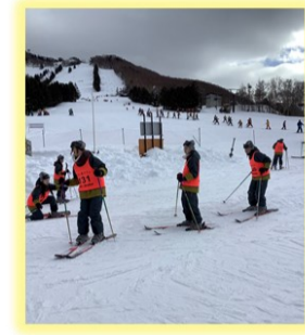
長野県高天原スキー場