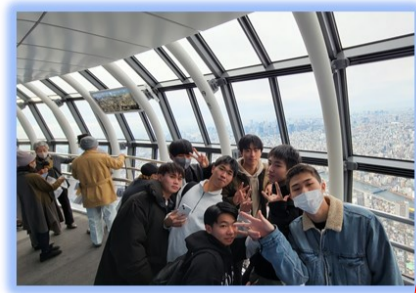
東京スカイツリー