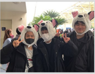
東京ディズニーランド