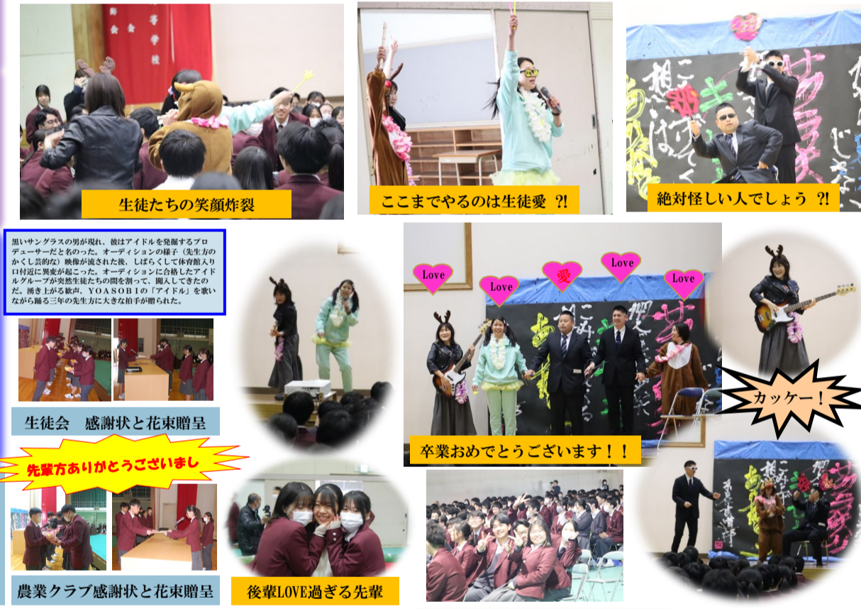
生徒たちの笑顔炸裂