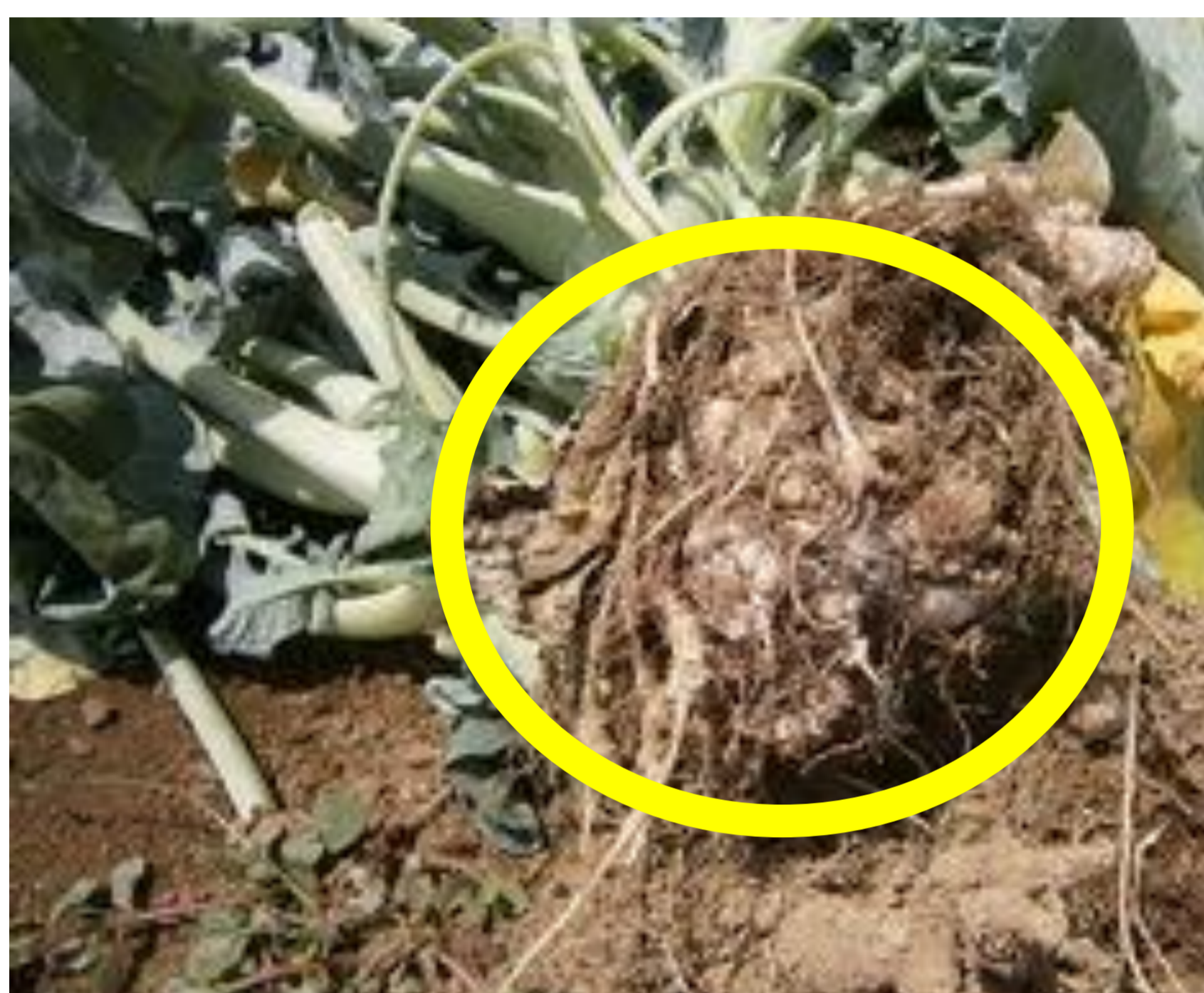
ブロッコリー根こぶ病