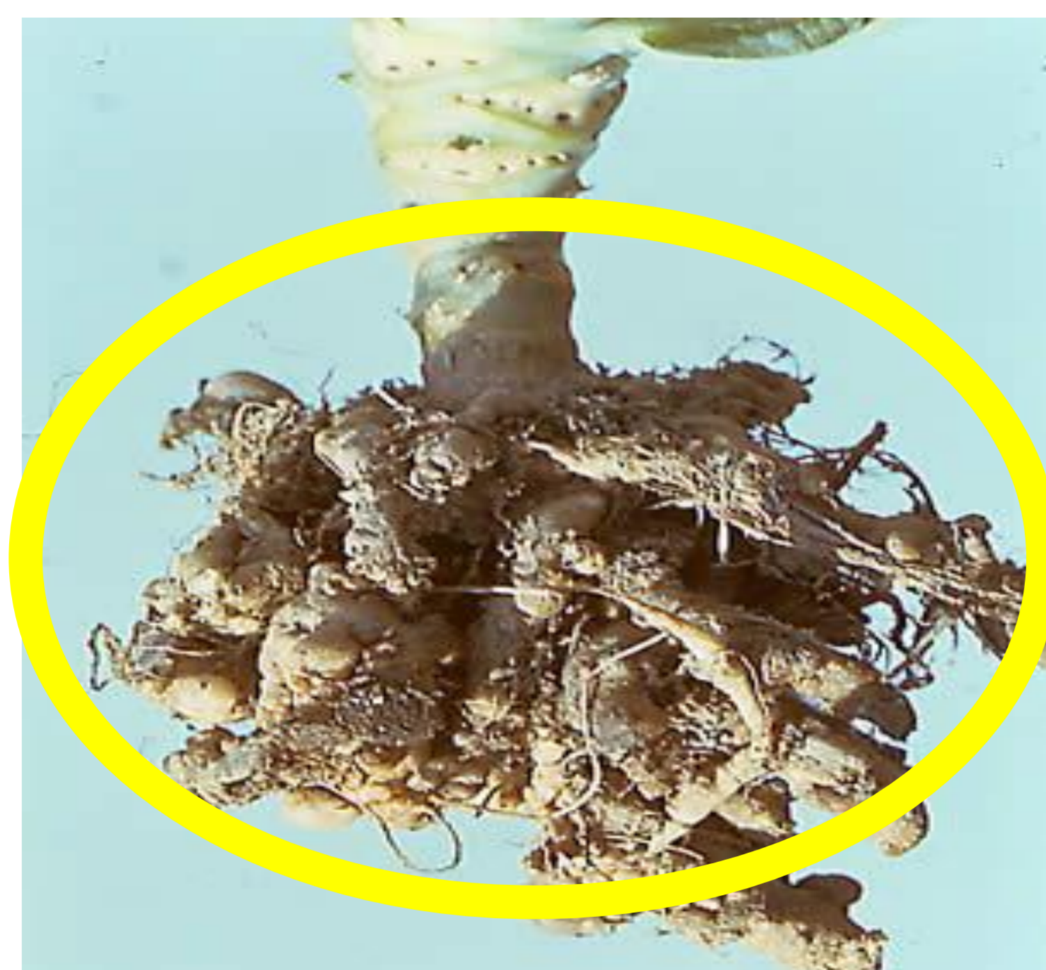
キャベツ根こぶ病