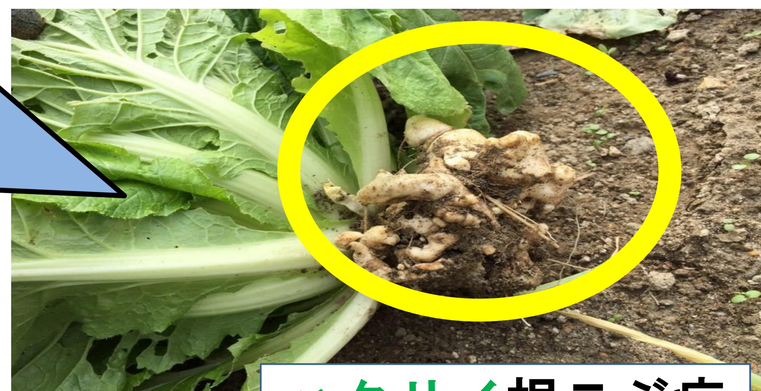
ハクサイ根こぶ病