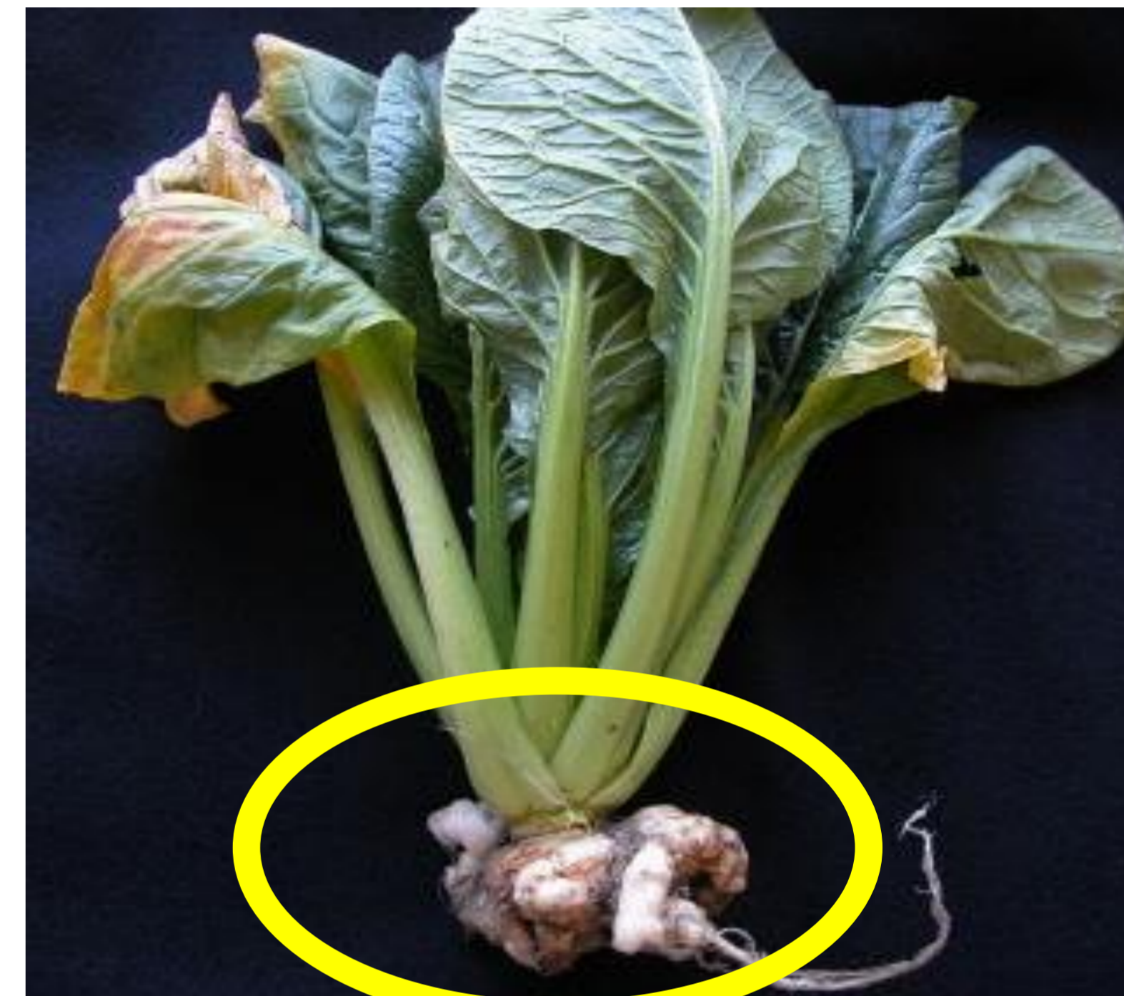
コマツナ根こぶ病