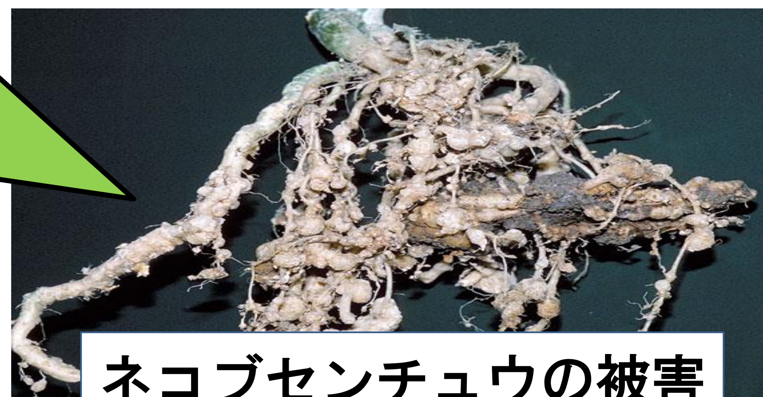
ネコブセンチュウの被害