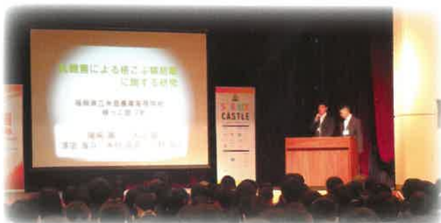
根こぶ病対策活動