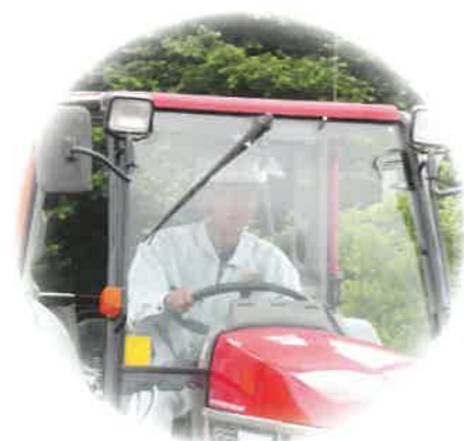
農業機械技術検定