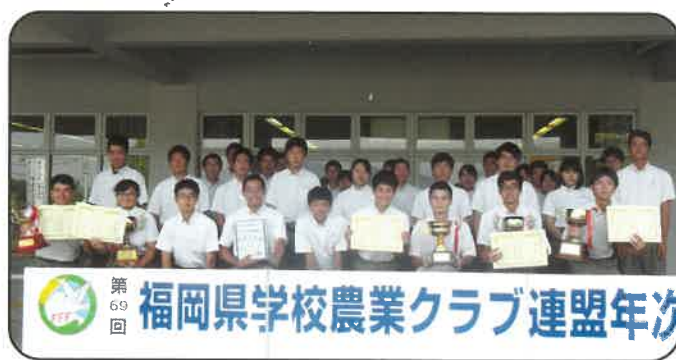
第69回 福岡県学校農業クラブ連盟年次