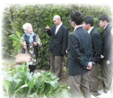
糸島伝統野菜の継承活動